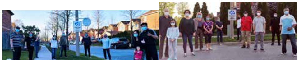
我們區內新成立的Deib Cres(左)和Kenborough Ct(右)鄰里守望計劃群組,共同維護鄰里安全。如有興趣加入或了解更多,請聯繫我的辦公室。