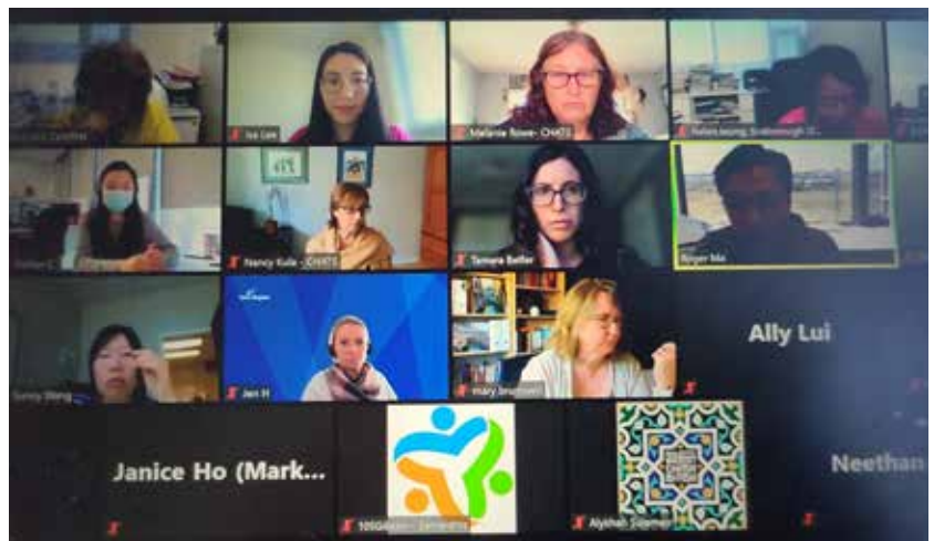
參加了由耆暉會領導的優先社區計劃每月圓桌會議。