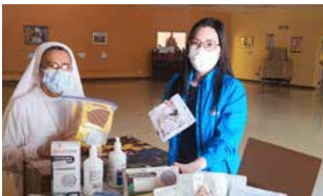
將本地企業和組織捐贈的物資送到位於Risebrough Circuit的St Mary of Leuca日託中心。